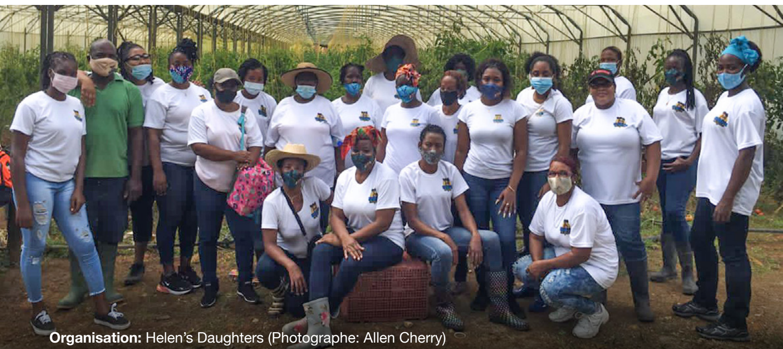
Organisation: Helen's Daughters (Photographe: Allen Cherry)

De plus, la majorité du financement climatique (57%) est distribuée sous forme de prêts, au lieu de subventions. Cela renforce les inégalités régionales et l'héritage colonial en augmentant le poids de la dette pour les pays déjà bien plus affectés par le changement climatique. 12 Les mécanismes d'évaluation du financement climatique sont souvent lents, complexes, gourmands en ressources et basés sur des projets, avec un manque de transparence global et peu de mécanismes basés sur l'octroi de subventions. 13 Un nouveau rapport de l'OCDE met en exergue la façon dont ces obstacles et inégalités systémiques empêchent les organisations de la société civile locales d'obtenir les ressources nécessaires pour mener leur travail à bien. En effet, les financements qui parviennent jusqu'à ce niveau sont limités et irréguliers. 14