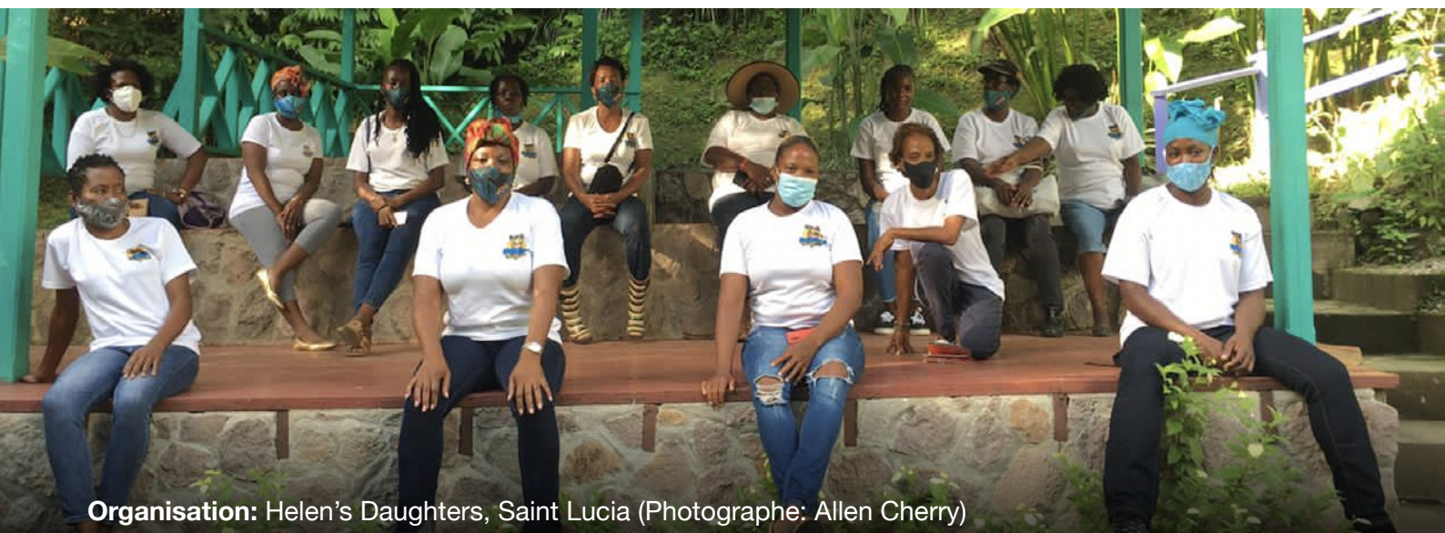
Organisation: Helen's Daughters, Saint Lucia

Une grande partie de leur travail a été décrite dans la littérature sur les solutions climatiques respectant la justice de genre. Ce terme décrit les approches de terrain consacrées à la défense des droits et axées sur l'humain, qui placent la justice de genre et la démocratie au cœur de l'action climatique, et cherchent donc à traiter directement les causes de l'injustice climatique. Comme l'explique l'organisation WEDO dans son Feminist Agenda for People and Planet , la crise climatique est ancrée dans une idéologie de croissance illimitée. Or, sur une planète dont les ressources sont limitées, cette vision n'est possible qu'au moyen d'extractions, d'exploitations et de destructions. 2 En remettant en question les structures du pouvoir existantes et en s'attaquant aux causes de la crise climatique, les mouvements féministes bouleversent la notion traditionnelle de l'action climatique, en contribuant à des changements plus larges du fonctionnement de nos économies et sociétés. Surtout, ces mouvements adoptent une approche intersectionnelle. Ils développent des réseaux inclusifs, résilients et basés sur la confiance, qui mettent en avant les connaissances et points de vue de divers groupes dirigés par les populations locales et structurellement marginalisés.