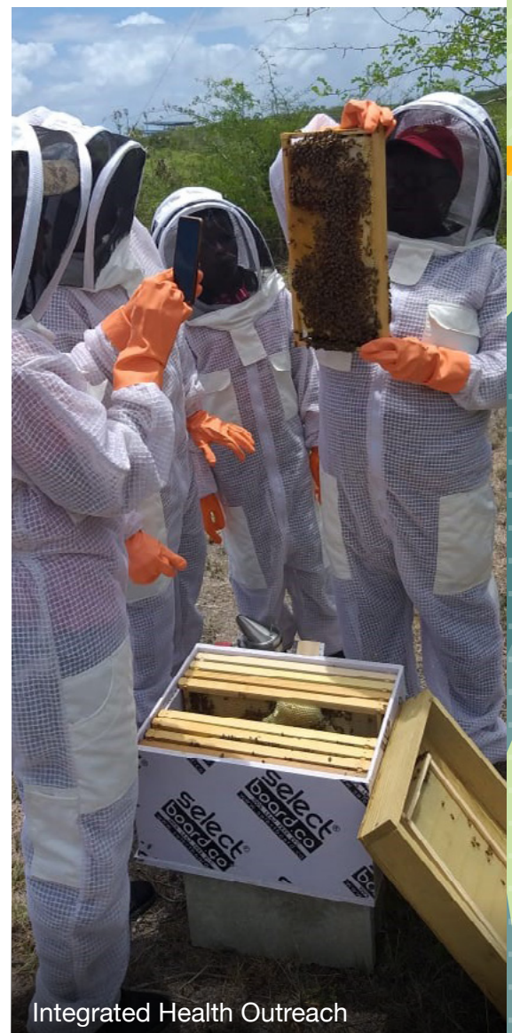
Integrated Health Outreach

Cependant, la justice climatique est bien plus susceptible de progresser en soutenant les organisations en première ligne plutôt qu'en conservant les cadres actuels. Ceci s'explique par le fait que les définitions restrictives du risque négligent deux risques plus urgents et plus réels. Tout d'abord, le risque de renforcer un statu quo injuste, le même qui a entraîné la crise climatique. Les militant.e.s doivent être soutenu.e.s pour pouvoir y faire face. Ensuite, les activistes féministes, en particulier les femmes autochtones et les défenseuses des droits humains et environnementaux des femmes, mènent des actions de justice climatique à leurs risques et périls et font souvent face à des représailles sévères, ce qui menace leur santé et leur sécurité. Depuis 2021, 1 910 défenseuses de l'environnement et de terres ont été tuées, dont 34 % provenaient de communautés autochtones. 40 Malgré ces risques, ils et elles continuent d'assumer leur rôle de leaders de ces mouvements, apportant un point de vue essentiel au travail sur la justice climatique aux niveaux local, national, régional et international. Les donateurices doivent se montrer à la hauteur du courage de ces activistes et octroyer leurs financements selon un cadre basé sur le potentiel et l'opportunité.