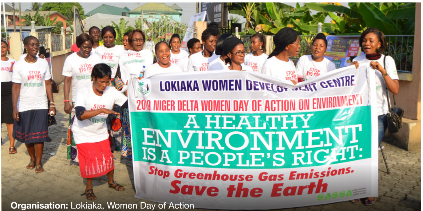
Organisation: Lokiaka, Women Day of Action

De plus, les fonds pour les femmes sont essentiels pour atténuer le risque, tel qu'il est traditionnellement défini par les donatrices, et pour une meilleure compréhension du risque, car ils ont l'expérience et les ressources pour répondre aux exigences des donatrices en matière de risque. Une approche par portefeuille pour financer diverses organisations permet aux fonds féministes de répartir le risque sur l'ensemble du portefeuille et d'entretenir un principe de confiance avec leurs partenaires. Grâce à leur intégration dans les mouvements qu'ils soutiennent, les fonds pour les femmes disposent aussi des outils, des réseaux et de la connaissance du contexte local, ce qui leur permet d'assurer la sécurité des activistes et de mieux répondre aux besoins de leurs partenaires. Enfin, les fonds pour les femmes ont la capacité de répartir des sommes importantes entre de nombreuses petites organisations, avec un impact majeur. Ainsi, ils reconnaissent les avantages à soutenir un éventail de mouvements féministes pour faire progresser la justice de genre, sociale, raciale et climatique. Il reste du travail à accomplir pour recueillir des données sur les stratégies et l'impact des organisations féministes en matière d'action climatique. Avec des ressources adéquates, les fonds pour les femmes peuvent atteindre leur plein potentiel en mettant en évidence l'impact des mouvements et organisations qu'ils soutiennent, et en partageant les leçons et les stratégies du succès.