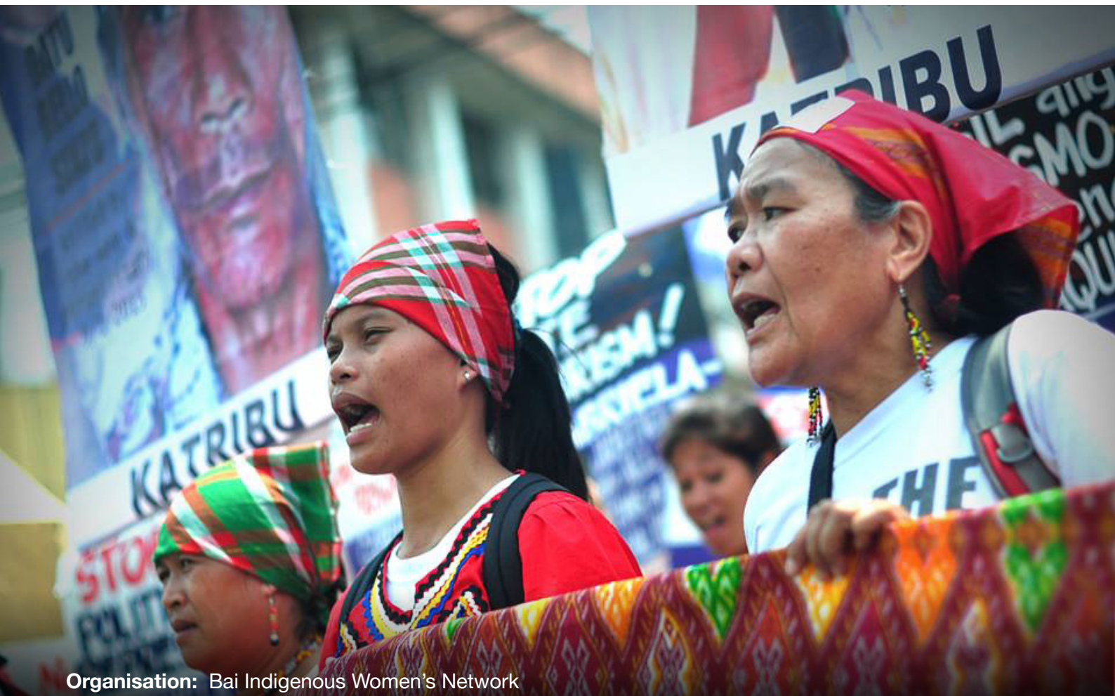
Organisation: Bai Indigenous Women's Network

WEDO: Women's Environment Development Organization (Organisation des femmes pour l'environnement et le développement)