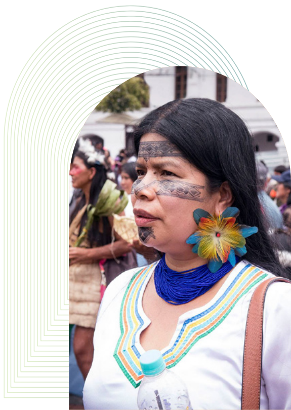
Mujeres Amazónicas Defensoras de la Selva

Malgré le rôle crucial des mouvements et organisations féministes dans les progrès en matière de justice climatique et d'objectifs de développement, 18 les organisations pour les droits des femmes ont reçu à peine 547 millions USD en 2020-2021, soit 1 % de l'APD totale dédiée à l'égalité des genres et à l'autonomisation des femmes (données de l'OCDE). 19 Tandis que la littérature sur l'intersection entre égalité des genres et environnement identifie bien la nécessité de soutenir et d'impliquer les mouvements et organisations féministes, y compris les OCS locales, les populations autochtones et les communautés locales, 20 à peine 0,22 % de l'APD liée au climat a été allouée à des organisations de défense des droits des femmes en 2018-2019. 21 De même, sur le montant total des dons philanthropiques alloués aux problèmes climatiques, 3 % de la somme a servi à soutenir l'activisme environnemental des femmes. 22