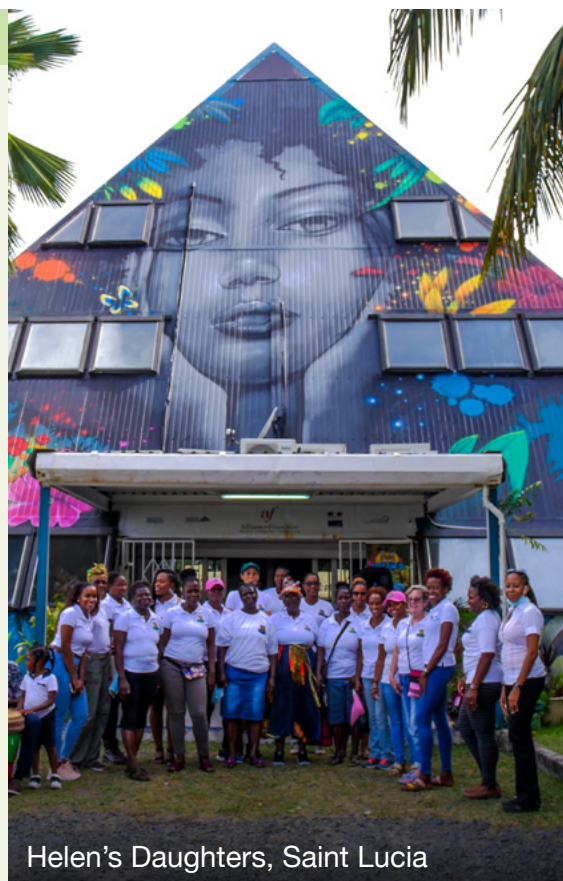
Helen's Daughters, Saint Lucia

Cette organisation de lutte pour les droits des femmes adopte une approche transversale, qui reconnaît et gère les dynamiques complexes du genre, de la justice climatique et de l'agriculture. Ses programmes globaux intègrent l'éducation (programmes de formation, bourses scolaires, apprentissages), le soutien aux agricultrices (subventions, accès au marché), et la santé et le bien-être (dispensaires ruraux, assurance maladie). L'un des impacts les plus notables de Helen's Daughters est la redéfinition de ce que signifie être une femme dans le domaine de l'agriculture, en commençant par le regard que les agricultrices portent sur elles-mêmes. C'est ce qui a permis à des femmes qui se sentaient invisibles de reconnaître l'importance de leur rôle dans la sécurité alimentaire de Sainte-Lucie.