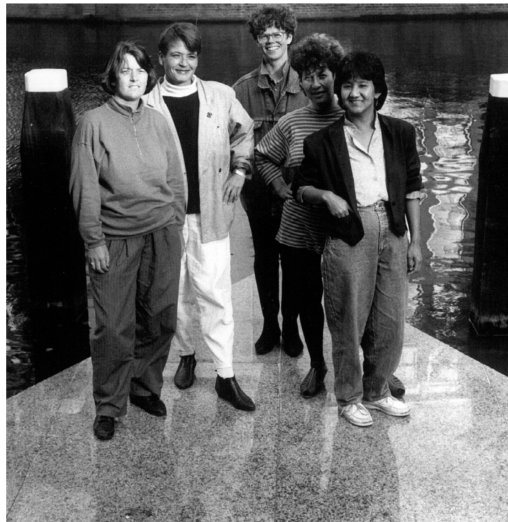
Основатели Mama Cash в 1980-ые.

Развитие фонда Mama Cash продолжается в течение почти четырех десятилетий, но наша истинная суть и миссия неизменны. Наш фонд остается спонсором бесстрашного феминистского активизма.