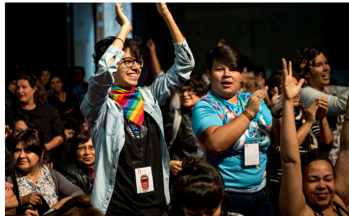
Конференция Venir a Sur в Мехико, 2018

ПОДОТЧЕТНОСТЬ — мы осознаем, что работаем совместно с другими людьми, и несем ответственность перед теми, с кем мы разделяем эту работу. Мы стремимся к открытости в предоставлении и получении обратной связи, к прозрачности и разделению полномочий при принятии решений, а также к честности в наших коммуникациях.