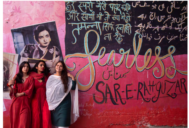
Fearless Collective, Шри-Ланка

Наша стратегия сопровождения помогает партнерам-грантополучателям приобретать, повышать и сохранять навыки, знания, инструменты, оборудование и другие ресурсы, необходимые для выполнения их задач. Поддержка может быть как финансовой, так и нефинансовой.