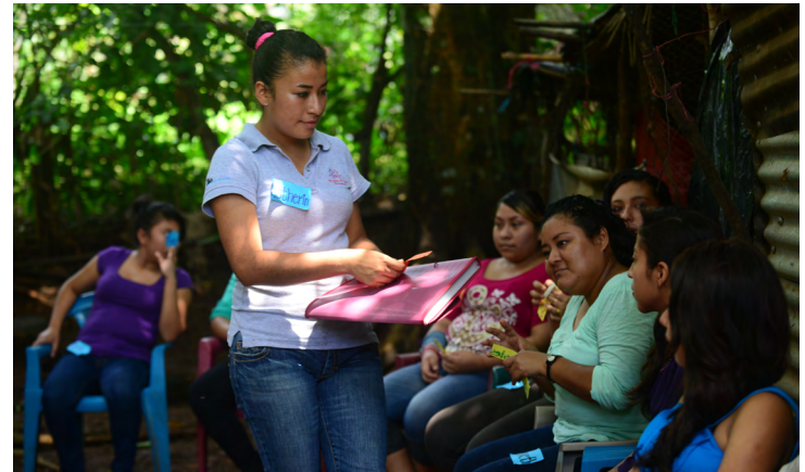
Mujeres de Xochilt, Сальвадор

Mama Cash постоянно развивается и растет благодаря циклическому процессу планирования, внедрения, оценки, обучения и адаптации своей практики, чтобы лучше реагировать на потребности феминистских движений. Являясь активной феминистской организацией, мы стремимся постоянно повышать свою осведомленность и понимание того, что хотят получить от спонсоров феминистские активисты и движения для преуспевания и эффективной работы, а также улучшать вклад Mama Cash в достижение их целей.