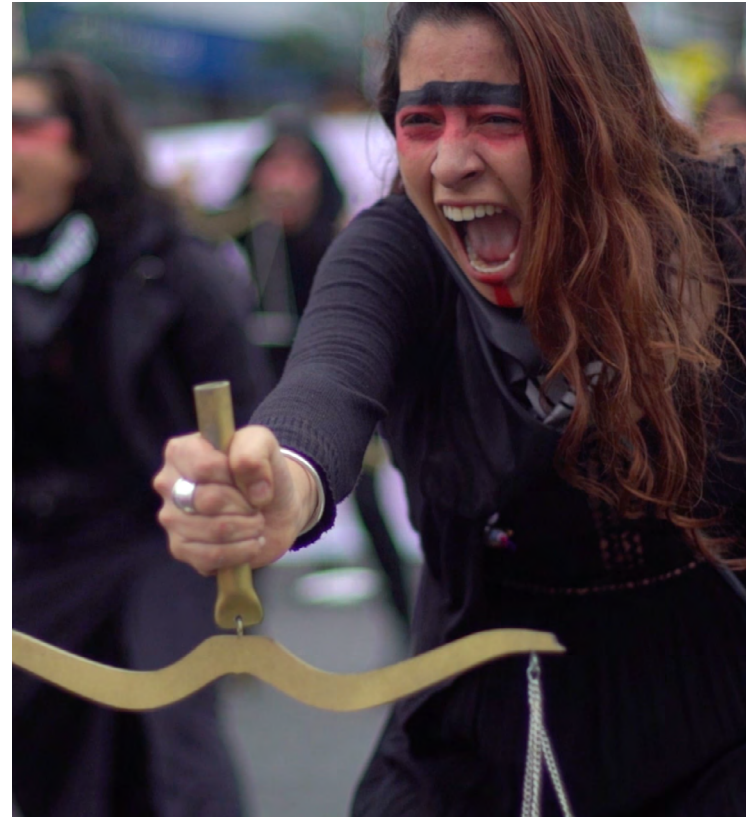
Chola Contravizual, Пепу

Начало 2020-х годов навсегда отмечено глобальной пандемией COVID-19 и выступлениями в защиту жизни чернокожих людей во всем мире. Работа активистов по принятию мер в ответ на неравные последствия пандемии, а также по возвышению и защите жизни чернокожих демонстрирует, как давно укоренившиеся нормы, поведение и системы могут быть изменены (и даже отменены), если прилагать обдуманное и целенаправленные усилия.