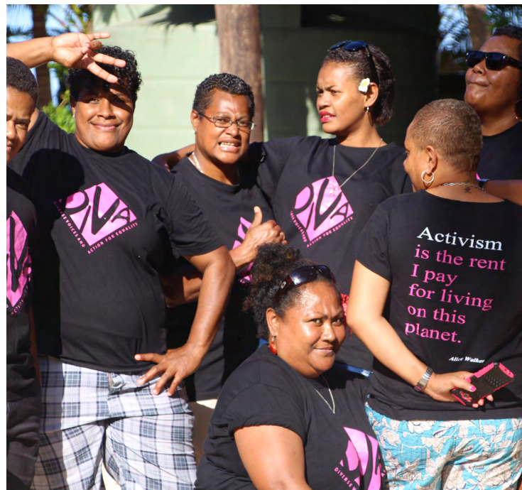
DIVA for Equality, Фиджи

Правозащитным организациям отважных женщин, девочек, транс- и интерсекс-людей во всем мире требуется финансирование и сети поддержки для того, чтобы развивать и преобразовывать свои сообщества. Mama Cash мобилизует ресурсы, получаемые от отдельных лиц и организаций, предоставляет гранты самоуправляемым феминистским организациям и помогает создавать партнерства и сообщества, необходимые для успешной защиты и продвижения прав женщин, девочек, транс- и интерсекс-людей во всем мире.